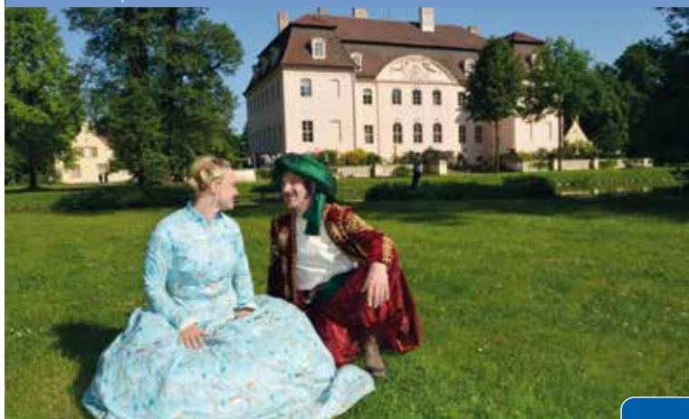
Das Fürstenpaar vor Schloss Branitz